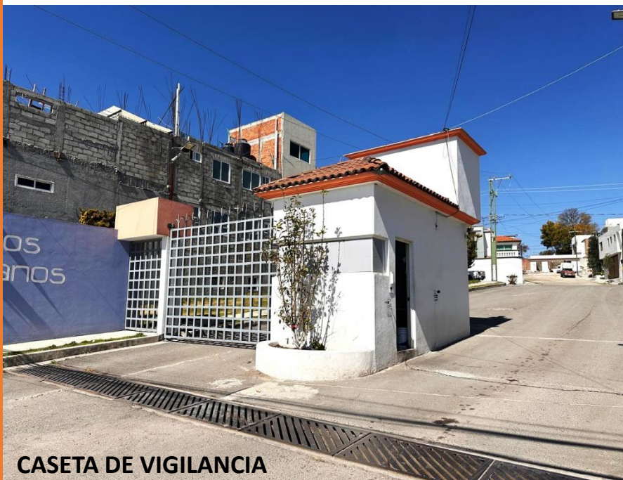
CASETA DE VIGILANCIA